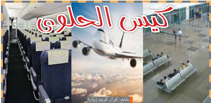
بقلم: كزار كريم زيارة

الشهر السرياني (التقويم الآرامي) أيلول: الكلمة بابلية الاصل يقابلها في العربية، (ول) بمعنى الصراخ والعويل، وتقام في هذا الشهر المناحة (النواج) على الاله تموز.